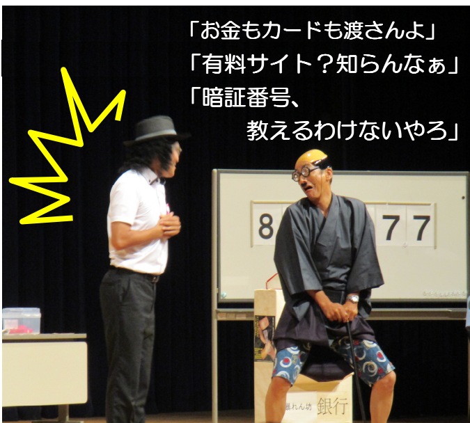
翠波友の会(若手警察官)による特殊詐欺被害防止寸劇

「お金もカードも渡さんよ」 「有料サイト? 知らんなあ」 「暗証番号、 教えるわけないやろ」