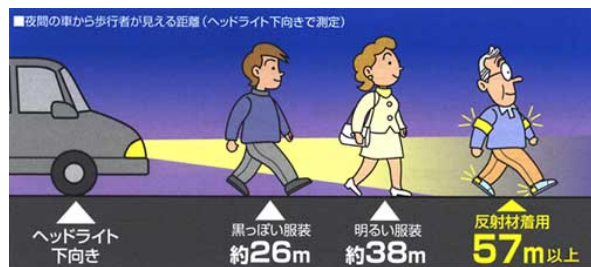
夜間の車から歩行者が見える距離（ヘッドライト下向きで測定）