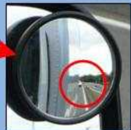
補助ミラーでは真後ろの緊急車両を確認できる。