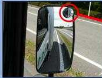
サイドミラーでは緊急車両を確認できない。