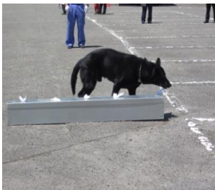
臭気選別は見事の中！