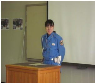
凛々しい女性白バイ隊員