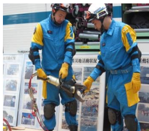
機動隊装備資機材実演