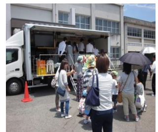
交通教育車は大盛況！