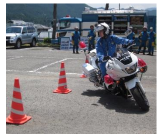
華麗な白バイさばき