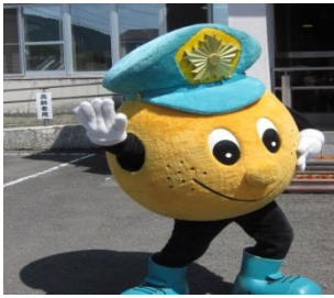
イベントスタート！！