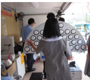
反射神経はどうか？