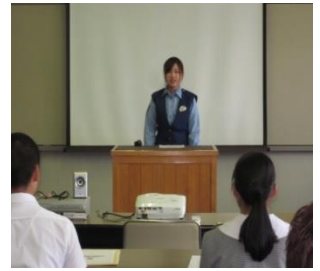
優しい女性警察官