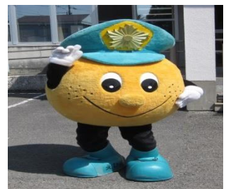
多数のご参加ありがとうございました！