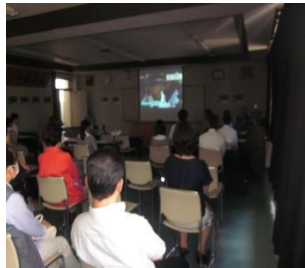
警察の仕事の紹介