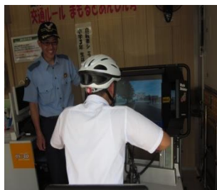
自転車シュミレーター