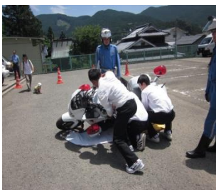
白バイの重さを体感