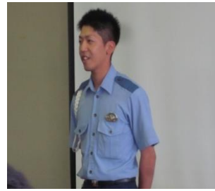
熱弁する男性警察官