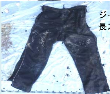
ジャージ 長ズボン