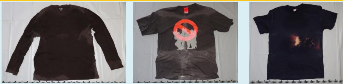
手提げバッグ内のTシャツ