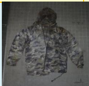
フード付きパーカー