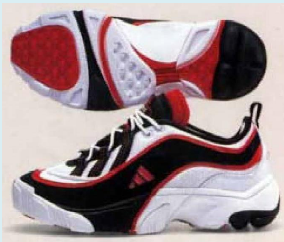
亡くなった人が履いていたものと同種の運動靴