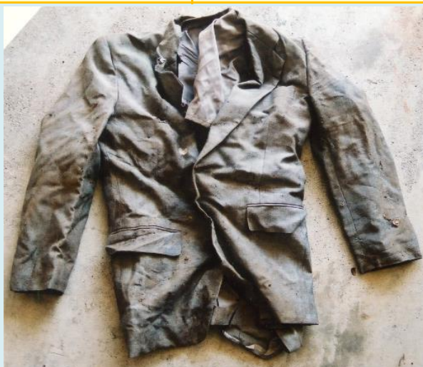
茶色長袖ブレザー