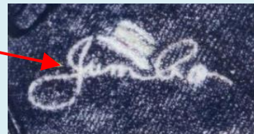
胸部の文字・マーク