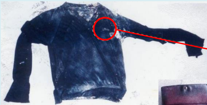
黒色長袖セーター