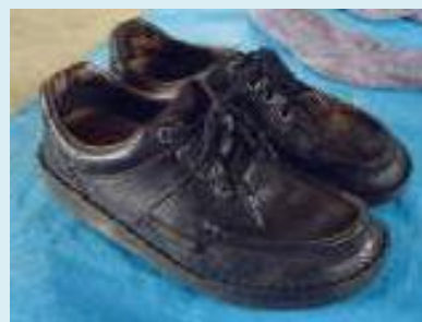
黒色カジュアルシューズ