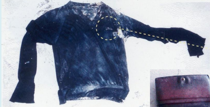
(黒色長袖セーター)