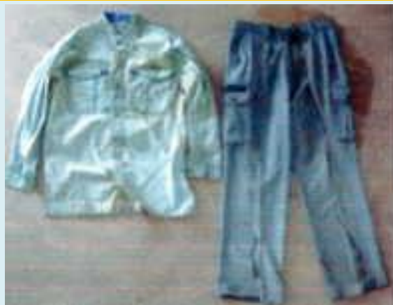
作業服上衣・作業服ズボン