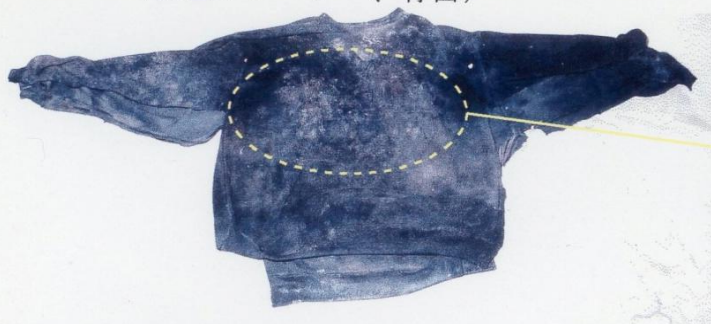
(黒色トレーナー、背面)