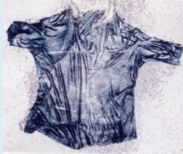
黒色半袖ポロシャツ