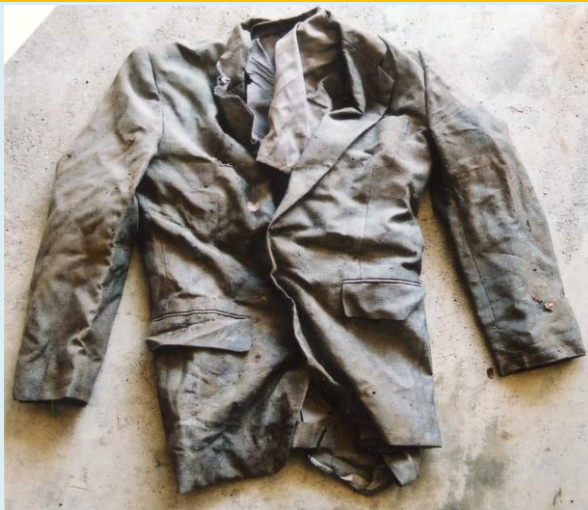
茶色長袖ブレザー