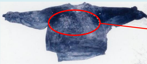
黒色トレーナー（背面）