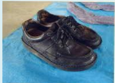
黒色カジュアルシューズ