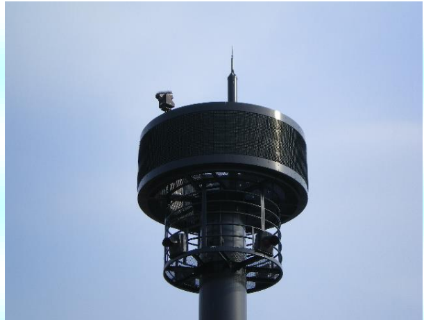
[放流情報表示装置]