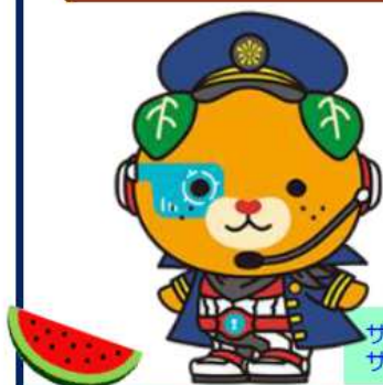
サイバー犬隊長 サイバーみぎゃん

https://www.fortiguard.com/psirt/FG-IR-23-183