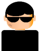
攻撃者 (A社のなりすまし)