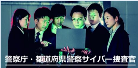
警察庁・都道府県警察サイバー捜査官

全国の約3,600人がサイバー空間の脅威への対処に専従 全国で『サイバー犯罪捜査官』が活躍中