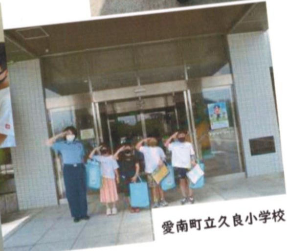
愛南町立久良小学校