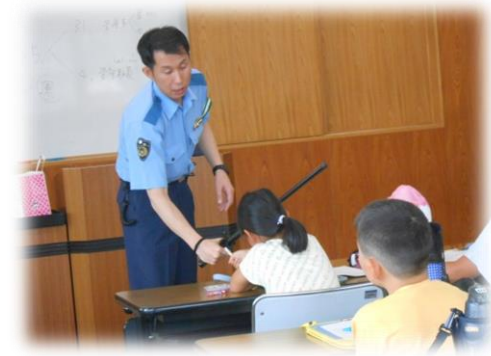
・ 警棒は伸びるんだよ。