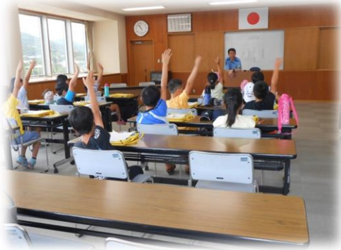
・ 答えの分かる人 ハイ！

一本松小学校と篠山小学校の 4 年生の皆さんが、愛南警察署を訪れました。教室での勉強でしたが、皆さん質問に元気よく答えていました。