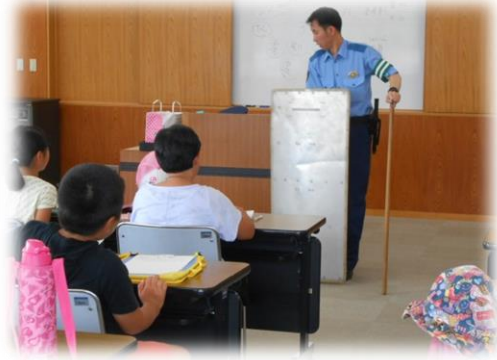
・ 装備品の説明をしています。