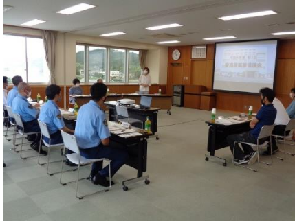
協議会開会の状況