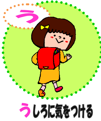
うしろに気をつける