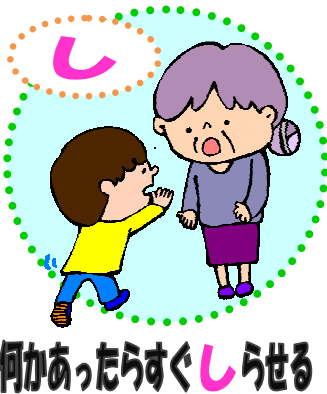
何かあったらすぐしらせる