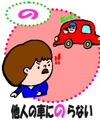
他人の車にのらない