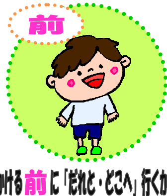
でかける前に「だれとどこへ」行くか伝える