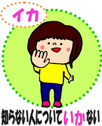
知らない人についていかない