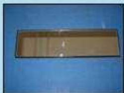
ワイドミラーの例