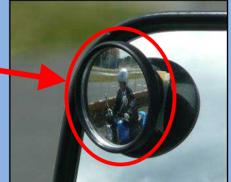
補助ミラーでは死角にいる自動二輪車を確認できる。