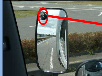
サイドミラーでは自動二輪車を確認できない。