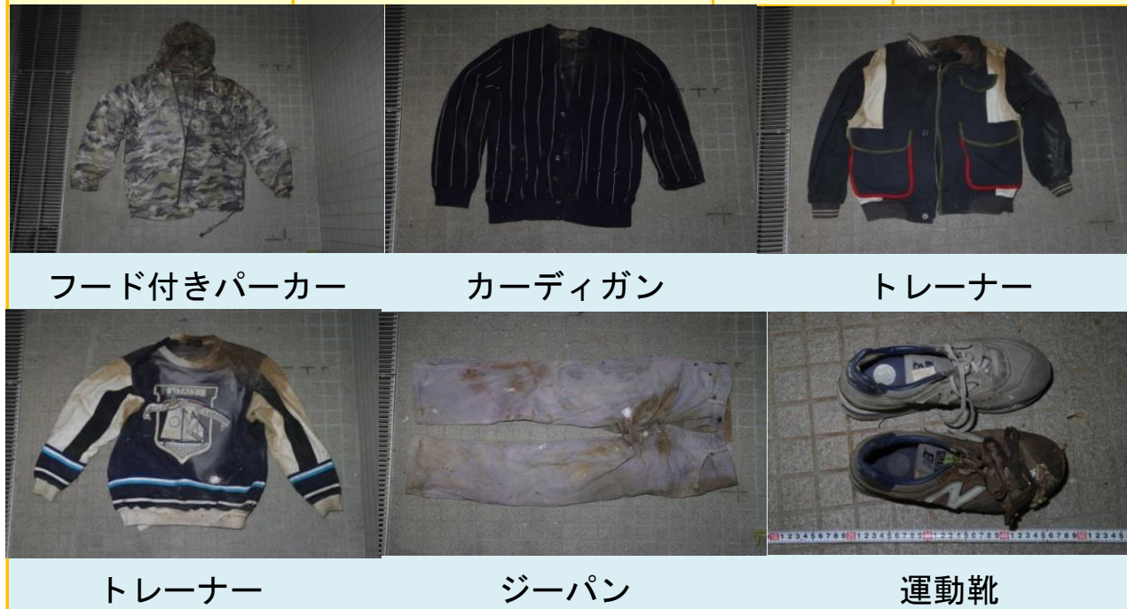
フード付きパーカー