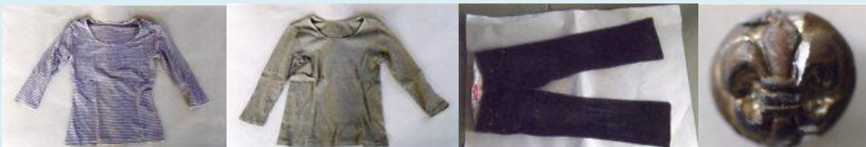
長袖シャツ(ボーダー) 長袖シャツ(緑色)