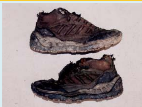
トレッキングシューズ