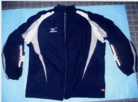
ナイロンジャンパー