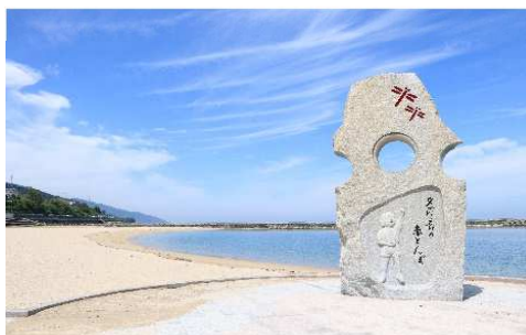
ふたみシーサイド公園