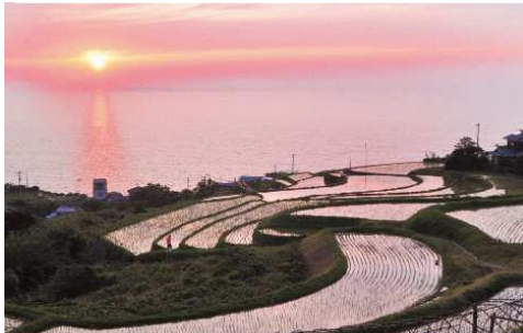
本谷（双海町）の棚田