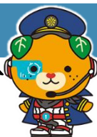
サイバーみきゃん

参考元：IPA『ビジネスメール詐欺特設ページ』( https://www.ipa.go.jp/security/bec/index.html )